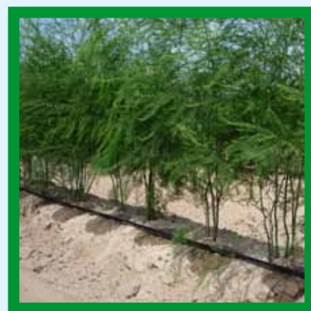
Tropfer-Labyrinth mit turbulentem, selbstreinigendem Fluss